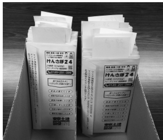
練馬支部事務所保管している資格確認書や資格情報のお知らせ

「迷子のお知らせをいたします。〇〇様、健康保険証代わりの資格確認書をお預かりしています。練馬支部事務所までお越しください」「(マイナンバーカードに保険証をひも付けた「マイナ保険証」の利用者に渡される)資格情報のお知らせが練馬支部事務所でお連れ様をお待ちです」