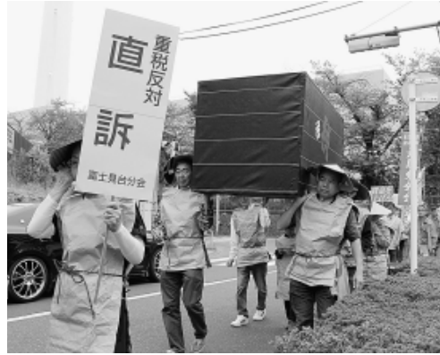
仮装スローガンコンテストで入賞した上から北大泉、新大泉、富士見台の各分会の仲間

第26回世直しだいこん2・3kmをパレード。行進が4月20日に行われ、練馬支部の仲間(219人)や、共闘団体の練馬区労働組合総連合、練馬区労働組合協議会のメンバーら計300人が集まりました。