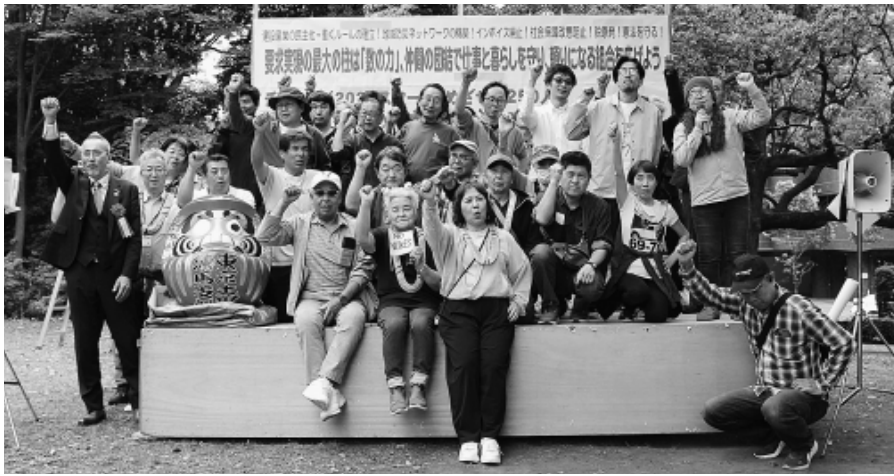
出陣式で氣勢を上げる練馬支部の役員や分会の代表者