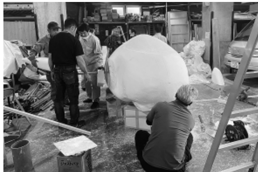
練馬支部会館の駐車場で作業を進める仲間

「ねりまジェット」は、練馬支部の仲間が力を結集して作り上げた。これまでの経験や実績が証明されています。私たちの要求、「夢」を乗せたねりまジェットは、現を目指して大きく羽ばたきました。