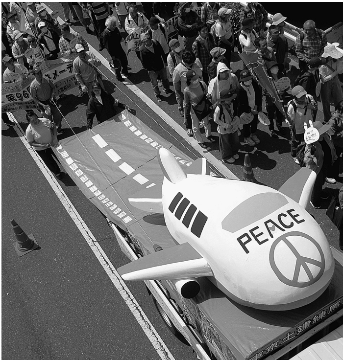
代々木公園周辺を“練り歩く、ねりまジェット”

「ねりまジェット」は、練馬支部の仲間が力を結集して作り上げた。これまでの経験や実績が証明されています。私たちの要求、「夢」を乗せたねりまジェットは、現を目指して大きく羽ばたきました。