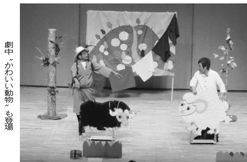
劇中「かわいい動物」も登場

練馬支部合唱団コスモスは8月18日、亀戸文化センターカメリアホール(江東区)で開かれた『孫たちのために平和を』コンサート(憲法9条を守り孫たちに平和を残したい)のシンジババの会主催)に出演。音楽劇「ヘレーじいさんのうた」を披露しました。7月に支部主催の憲法フェスタで初演し、2度目の舞台。メンバー8人は集まった280人の観客に臆することなく、ユーモアあふれる演技と息の合った歌声を響かせていました。