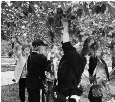
さくらんぼ狩りに興じる参加者

練馬支部女性の会は6月23日、夏の定例会としてバスハイク「吹割の滝&酒蔵見学&四季の味覚膳&さくらんぼ狩り」を開催し、23分会から子ども14人を含む99人が参加しました。 土砂降りの中練馬を発ちましたが、吹割の滝(群馬県沼田市)到着後、一時的にやんで、東洋のナイアガラ」と称される