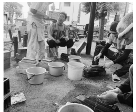
ひっきりなしに包丁を研ぐ分会の仲間

富士見台分会は6月9日、区立こぶし公園で住宅デーを開きました。今年には晴天に恵まれ、強い雨に見舞われた昨年より実に2倍の約400人が来場。分会機関紙「富士見台」6月号などにより、当日は仲間と家族の計33人が木工教室や飲食をはじめ、各コーナリの運営に当たりました。 毎回人気を集める包丁研ぎは177本、まな板削りは35枚が持ち込まれ、スタッフは次から次へと舞い込む注文に大忙し。また食も名物の一つに数えられており、焼きそばやフランクフルト、豚汁はいずれも完売しました。「屋にはみんなで盛り上げ、健康チェックコーナーを開設。他団体との連携を改めて確認した1日でした。」