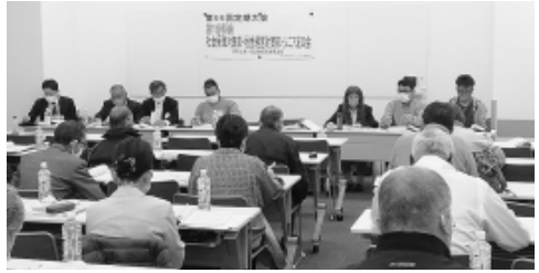
分科会も実施(写真は第一分科会)