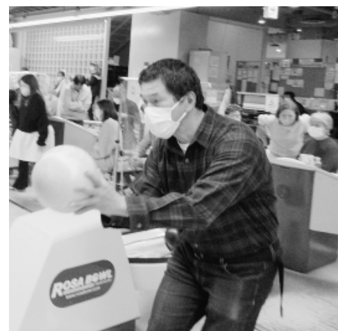
真剣な表情で狙うはストライク?!

「分会対抗ボウリング大会」へ向けて事前練習を行った分会もあり、大会当日は新しい若手の仲間や事業所の仲間も数多く参加。ボウリング仲間との交流を楽しみました。