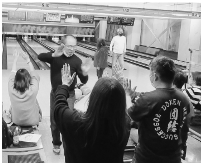
「ヨッシャー」分会の仲間とハイタッチ(春日)

大会終了後、練馬支部会館で行なわれた交流会&表彰式にも137人が参加。「楽しかった。ぜひ毎年開催してほしい」との声が数多く寄せられました。