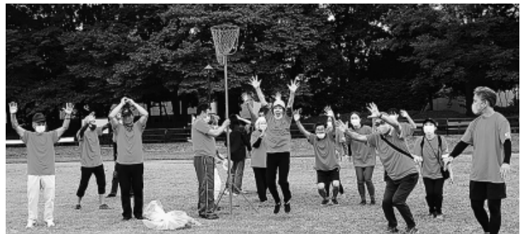
みんなで玉入れ 喜び爆発！優勝の旭町光が丘分会

秋の拡大月間後半戦に向け10月9日、光が丘公園陸上競技場で「拡大中間決起レクリエーション」をひらき、全分会から組合員・家族403人が参加。コロナ禍が始まって以降、最大の支部行事となりました。