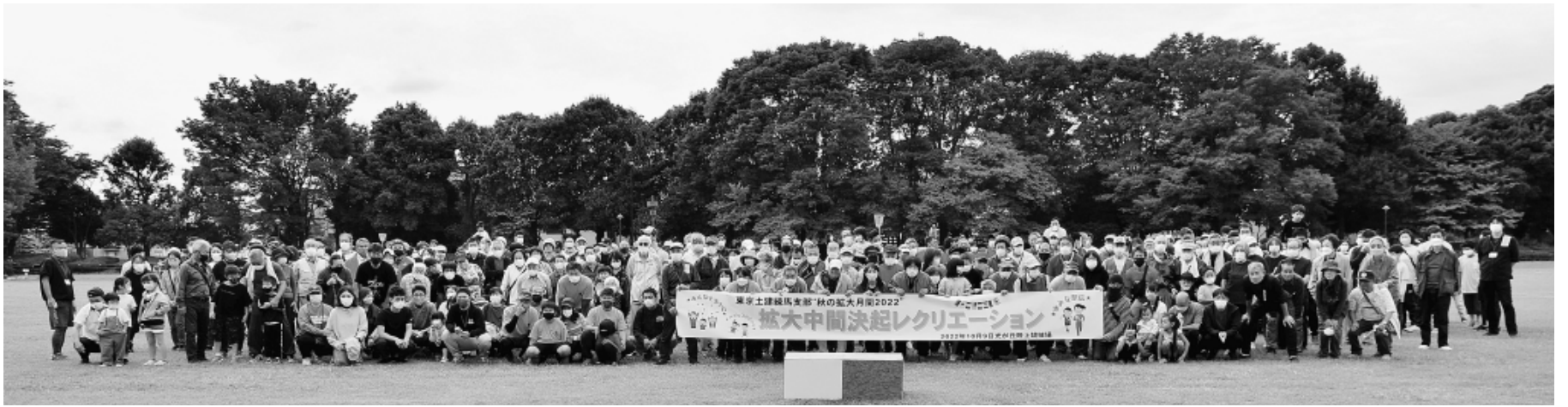
壮観！全分会総勢403人の集合写真