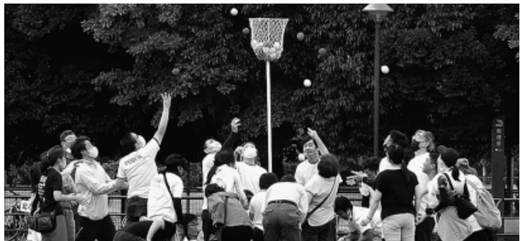
みんなで玉入れ 最多の38人が参加した準優勝の北事業所分会

熱戦が繰りひろげられました。「きずな駅伝」(1200mリレー)には15分会が参加。最大5人でタスキをつなぐ分会のプライドをかけたたたかいは会場は大いに盛り上がりました。「みんなで玉入れ」では、子供からシニアまで分会の仲間みんなが楽しめました。「ちびっこかけっこ」にも多くの行動提起として、今日の到達を報告。後半戦集まった仲間の協力と団結で、拡大月間最後まで多くの組合員との対話をすすめるようよびかけました。