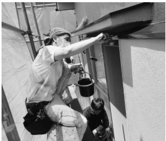
住宅相談WEEKで受注した外壁塗装を施工する分会の仲間