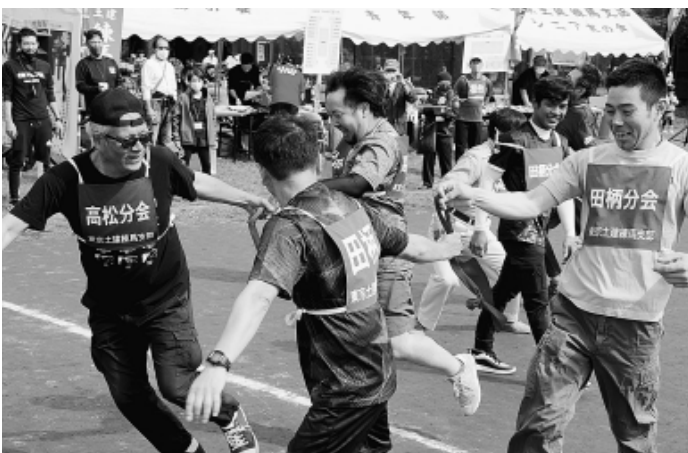
分会の仲間のきずなでタスキをつなぐ 一分会対抗きずな駅伝の熱戦