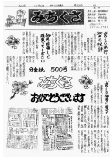
「みちくさ」通巻500号特集号

桜台分会の分会紙「みちくさ」が10月12日号で通巻500号を迎えました。桜台分会では、500号の通常号に加え、通巻500号の特集号を発行。「毎月楽しみに読んでいます」、組合員のための情報発信に感謝、下修教習部長は「まだまだ」 桜台分会の「みちくさ」に続き、上石神井分会あけぼの」があと4号で通巻400号、旭町光が丘分会「はなみずき」があと5号で通巻200号、早宮分会「どんぐり」と新豊玉分会の「新とよたま」があと2号でそれぞれ通巻200号を迎えます。また、石神井台分会女性の会の「ひだまり」が100号を迎え、9月18日にお祝い会が行われています。