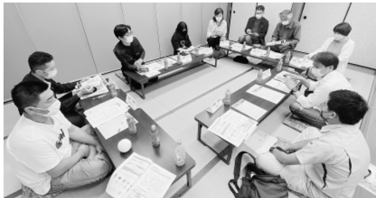
新加入者・組合初心者5人が参加した石神井分会の「説明会」