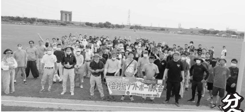
練馬、田柄、春日、大泉東、上石神井、旭町光が丘、石神井、新大泉、早宮、富士見台、分会合同、書記局の12チームが勢揃いした開会式

発行所 東京土建一般労働組合 城北ブロック会議 東京都豊島区西池袋5-22-15 板橋 (3963) 5325 練馬 (3825) 5522 豊島 (3986) 2471 北 (3902) 7121 発行人 代表者 川合 正人 発行日1日、9日、17日、25日