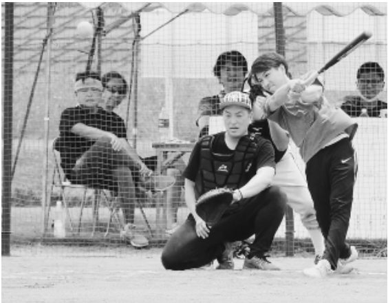
ナイスバッティング！手に汗握る熱戦が続きました

7月3日、埼玉県和光市の薬業健康グラウンドで、「分会対抗ソフトボール大会」が10年ぶりに開催されました。暑い空の下、10分会のチームと分会合同チーム、書記局チームの合計12チームが熱戦を繰りひろげました(参加者は16分会から153人)。