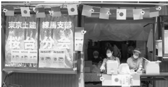
飾り付けした分会センターで募金を訴え

桜台分会は、分会センター近くの5軒ほどのお店と協力して、ウクライナ支援の募金にとりくみました。 募金にとりくんだきっかけは、災害時の非常食。消費期限が近づくなか、これを何かに役立てられないかと分会で考え、ウクライナへの支援に使うことを思いつきました。分会センターの近くの