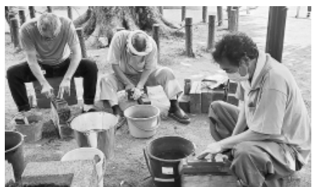
包丁研ぎも大忙し

6月5日、富士見台分会が「どけんまつり」をこぶし公園で開催しました。 当日は組合員と家族31人が運営にあたり、定番の包丁研ぎ・まな板削り、木工教室(車、214本・まな板削り48枚)のほか、射的、ストラックアウト、ダーツなど子どもたちも楽しめる企画を用意しました。