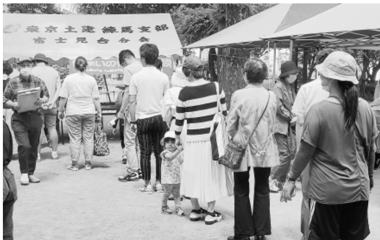
多くの地域住民が来場しました

6月5日、富士見台分会が「どけんまつり」をこぶし公園で開催しました。 当日は組合員と家族31人が運営にあたり、定番の包丁研ぎ・まな板削り、木工教室(車、214本・まな板削り48枚)のほか、射的、ストラックアウト、ダーツなど子どもたちも楽しめる企画を用意しました。