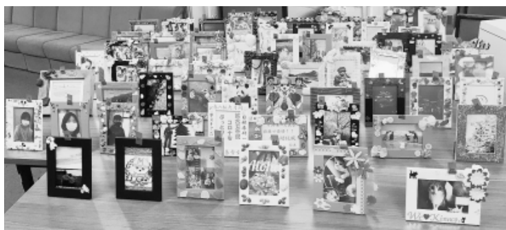
作品は支部事務所に展示

後継者対策部は、50歳未満の組合後継者世代とその家族を対象にさまざまな取り組みをおこなっています。 4月・5月には、後継者対策部が配布したフォトフレームにお気に入りの写真・自作の絵を入れて、デコレーションしたフォトフレームを募集・審査するフォトフレームコンテストを実施。「家族みんなで楽しく作れる」と好評で、全部で64作品が集まりました。 6月2日にひらいた後継者対策部会で審査を行い、次のとおり表彰者が決まりました。