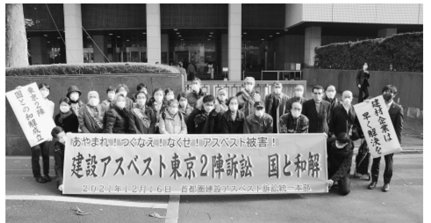
裁判所前に集った東京2陣原告の仲間 (12月16日・東京高等裁判所)