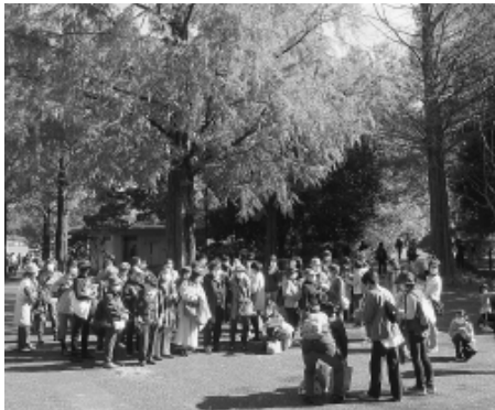
紅葉を前に会員集合(11月14日・昭和記念公園)

としたイベントで、募集人員の50人を大きく超える68人(家族21組)と運営委員の計74人が参加しました。続く11月14日には、支部定例会「昭和記念公園紅葉鑑賞」を開催し68人(15分会)の参加