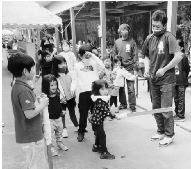
風船割りには子供に大人気

力です。会場に着くときつそくパン作り体験がスタートしました。各自アイデアをいかしてさまざまな形のパンをつくっていきます。大人も子供も、普段体験することのできない貴重な経験に夢中になって取り組みました。その後はお待ちかねのBBQ交流会。自然のなかで仲間や家族とともに食べる食事は格別。お腹いっぱい美味しいお肉やお酒を堪能しました。気づけば参加者の緊張感もほぐれ、分会の垣根をこえ、置し都内からもアクセスしやすい人気の観光地で、豊かな自然に囲まがあたりこち見られました。子供たちは風船割りを楽しみ、その後の園内散策ではゴーカートや巨大滑り台などのアトラクションを満喫しました。イバライドを出た後はあみプレミアムアウトレットでのお買い物つきで、見どころ満載のバスツアーは、終始笑顔の絶えない交流会となりました。