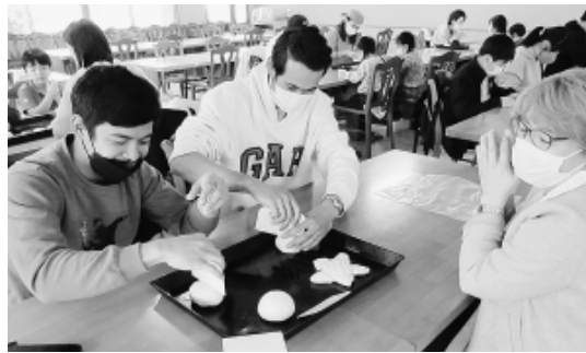
パン作り体験に大人も夢中

自然の中 貴重な経験の数々 置し都内からもアクセスしやすい人気の観光地です。豊かな自然に囲まがあたりこち見られました。子供たちは風船割りを楽しみ、その後の園内散策ではゴーカートや巨大滑り台などのアトラクションを満喫しました。イバライドを出た後はあみプレミアムアウトレットでのお買い物つきで、見どころ満載のバスツアーは、終始笑顔の絶えない交流会となりました。