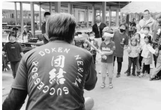
後継者対策部の背中に団結の文字