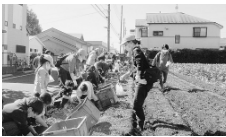
晴天のもと家族で芋掘りに夢中(10月24日・白石農園)

10月24日、白石農園で開催された「いあんぐま」野菜収穫体験・さつまいも収穫祭は2年ぶりの後継者層を対象