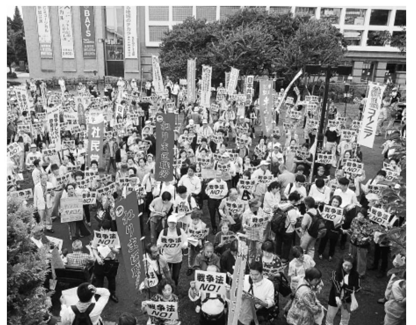
2015年・戦争法NO1ねりま集会