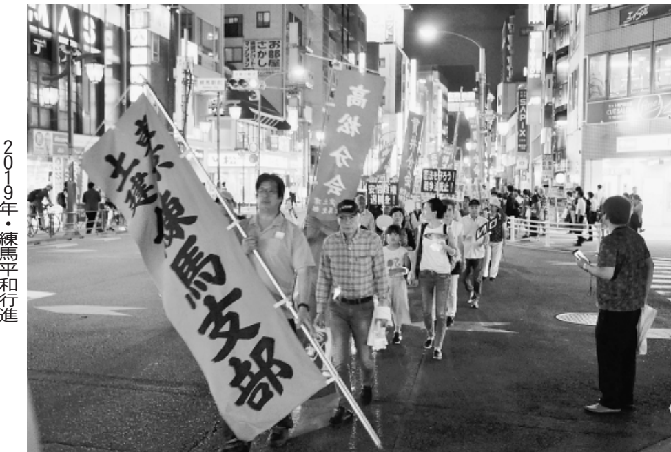
2019年・練馬平和行進

絶・平和を願う想いをつなぐ素 想も寄せられました。 晴らしい平和展でした」との感謝