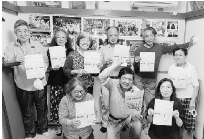
一度に17件もの大型加入があった旭町光が丘分会

「訪問行動自粛」のなか での電話かけがメインと なりましたが、今年には感 染防止対策に配慮したう えでの行動をすすめるこ とができました。さまざま なな制約がありながら も、各分会が拡大目標達 成を追求すべく仲間への 訪問、電話かけ、現場で の声かけなど、「できる こと」での行動に取り組 まれました。 分会センター内の飛沫 防止対策や、事前に電話 連絡したうえでの組合員