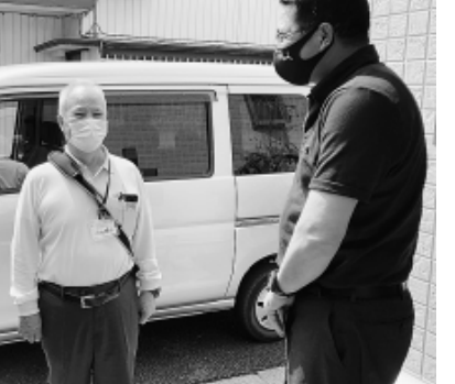
対話から様々な話題に発展(学園分会)