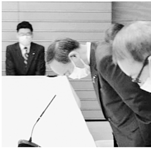
菅義偉総理大臣による原告への謝罪 (11月18日・首相官邸)