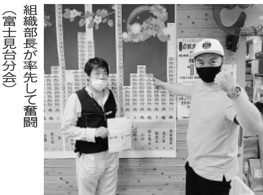
組織部長が率先して奮闘 (富士見台分会)

「訪問行動自粛」のなか での電話かけがメインと なりましたが、今年には感 染防止対策に配慮したう えでの行動をすすめるこ とができました。さまざま なな制約がありながら も、各分会が拡大目標達 成を追求すべく仲間への 訪問、電話かけ、現場で の声かけなど、「できる こと」での行動に取り組 まれました。 分会センター内の飛沫 防止対策や、事前に電話 連絡したうえでの組合員