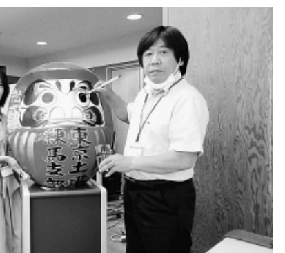
福岡委員長と上原組織部長