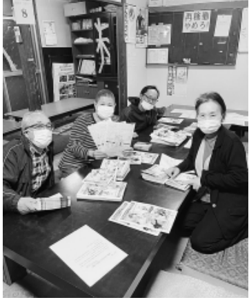
拡大行動日の関町分会の 仲間(4月19日=関町分 会センター)

この「春の拡大月間」 は、加入の約7割が事業 所新入職によるもので、 春の採用シーズンに伴い 1事業所で複数人の加入 もみられたほか、事業主 の家族の本人加入も4件 みられました。他、約3 割が個人事業主や一人親 村・富士見台・北大泉・ 南事業所分会