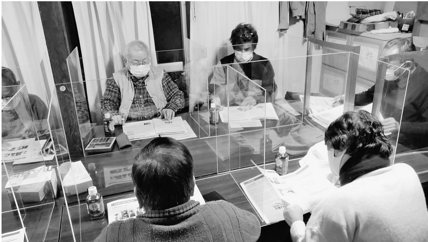
土支田分会（＝25日分会センター）

拡大も残り約1か月。情勢学習会で学んだ内容をいかしコロナ禍でもできる取り組みをすすめます。