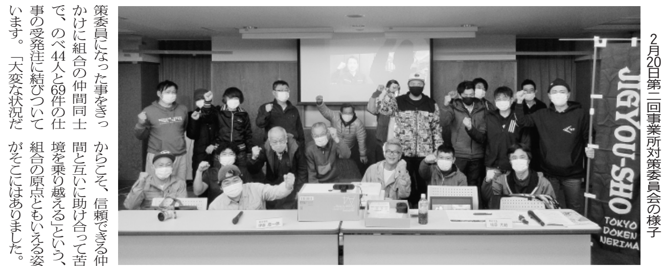
2月20日第二回事業所対策委員会の様子

策委員になった事をきっかけに組合の仲間同士で、のべ44人と60件の仕事を受発注に結びついて組合の原動力もいえる姿がそこにはありました。