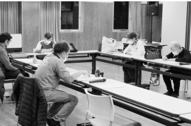
中村分会（＝26日練馬支部会館）