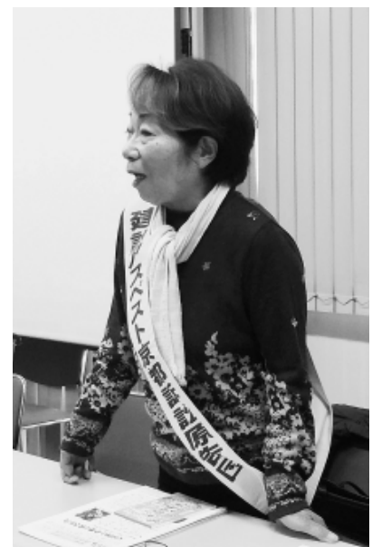
原告の仲間(京建労会館)

最高裁判所第一小法廷で審理されていた関西建設アスベスト訴訟は、京都一審訴訟が1月28日に、大阪一審訴訟が2月22日に、それぞれ国とメーカーの上告を棄却し、2018年の大阪高裁の判決が確定しました。京都一審訴訟は原告27人中24人に対して、2018年8月の2審大阪高裁判決のうち、国とメーカー10社中A&Aや日鉄ケミカル&マテリアル、大建工業(いずれも東京)など8社に計約2億8500万円の賠償を命じた判断が確定しました。大阪一審訴訟は原告32人中30人に対して、2018年9月の2審大阪高裁判決のうち、国とメーカー18社中A&Aや大建工業、ニチアス(いずれも東京)など7社に計約3億2900万円の賠償を命じた判断が確定しました。全国で展開される建設アスベスト訴訟において建材メーカー