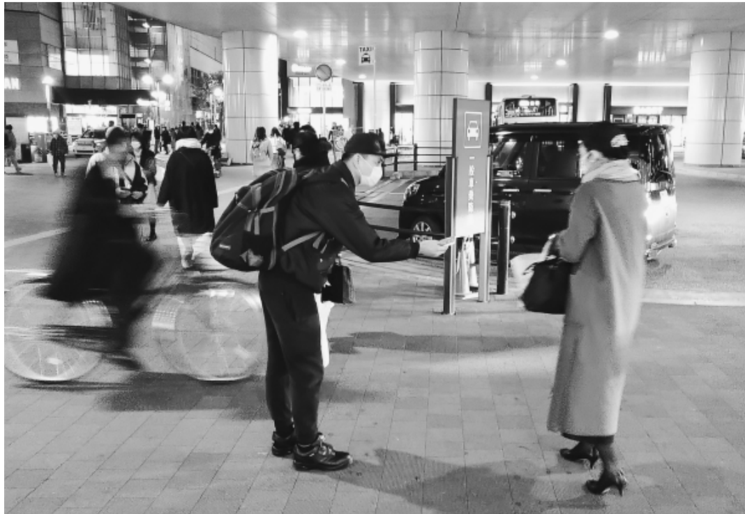
宣伝チラシを配布する技能実習生の仲間 (北事業所分会)

発行所 東京土建一般労働組合 城北ブロック会議 東京都豊島区西池袋5-22-15 板橋 (3963) 5325 練馬 (3825) 5522 豊島 (3986) 2471 北 (3902) 7121 発行人 代表者 佐藤 広平 発行日1日、9日、17日、25日