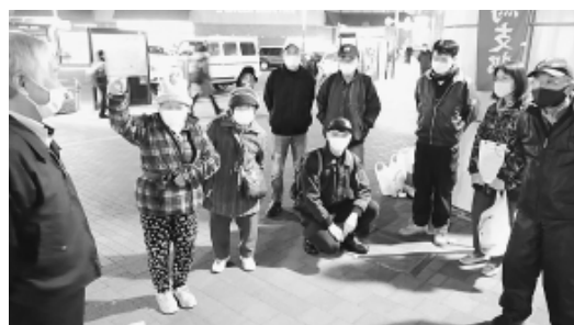
(1月27日=石神井公園駅前) 宣伝行動に参加した仲間達

申告書作成までを一对一でお手伝い 組合で行う確定申告(個別)相談会は2月16日から3月10日までの13日間で開催します。昨年の相談会参加者には日時指定の案内を発送しましたが、昨年相談会に参加していない方で相談を希望する方は、分会税対部長もしくは支部事務所までご連絡ください。 確定申告(個別)相談会 【会場・受付】練馬支部会館・午前10時～11時30分・午後1時～3時 【2月日程】16日・17日・18日・19日・25日・26日 【3月日程】1日・3日・4日・5日・8日・9日・10日