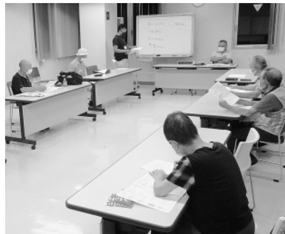
支部シニア友の会の会議の様子

練馬支部シニア友の会も元気に活動を再開しました。年間計画の見直しとコロナ禍での活動を議論し、シニア友の会の果たす役割をみんなで考えました。健康面、感染防 止を最大限に配慮しながら、できるだけこの実践にむけて、まずは代表者会議での意見集約にむけて準備を行いました。