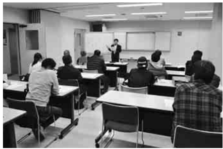
確定申告学習会(中・上級編)の様子

やはり確定申告には知識が必要。それと奥さんまかせだけでは、税理士さんから質問されても「お父さんに聞いてみな」とわからない」と上手いといかないし、時間がかかるといけない。時間がかかると、やはり本人が来た方が質問の受け答えができるからいい。本人がやるのが一番。忙しいとは思いますが、来年のために事前に用意することができた。奥さんまかせもいいかもしれないが、相手プロが見ればすぐわかってしまう。知識を得る時間は結局は無駄にならない。指摘される部分が少ない。指摘され少ない程度スムーズに終わるとよかった。