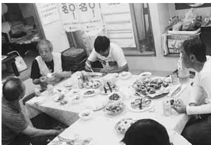
日曜行動後の中間決起(桜台分会)