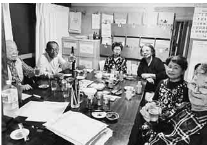
分会センターにて(土支田分会)

発行所 東京土建一般労働組合 城北ブロック会議 東京都豊島区池袋5-22-15 板橋 (3963) 5325 練馬 (3825) 5522 豊島 (3986) 2471 北 (3902) 7121 発行人 佐藤 広平 発行日 1日、9日、17日、25日