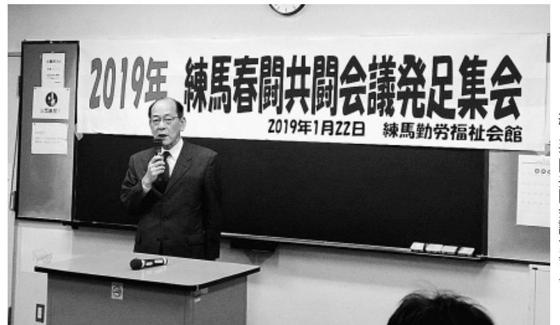
2019練馬春闘共闘会議が発足

全体で850人、練馬支部からは13人が参加しました。基調報告は、動画などの映像を交えながら過去の闘いや現状などを分かりやすく報告されました。各組合の決意表明では、ストライキをかまえて闘っているJMITU、パワハラ問題で闘っているIBM労組、雇止めを急激に組織拡大を進めている首都圏大学非常勤講師組合など、力強い報告がありました。東京土建からは、全支部の旗を持って登壇し、この間の現場前宣伝で現場を改善してきた取り組みの報告をしました。