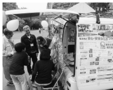
どれにする? (旭町光が丘分会)

練馬支部の住宅デーは6月10日(日)、区立公園を中心に26会場で開催しました。時折強い雨が降るなかでの開催でしたが、朝から支部事務所には区民からの「住宅デーはやりませんか?」との電話での問い合わせが相次ぎました。 各会場とも、雨のため、分会が計画していた地域諸団体と協力した企画(小学生による沖繩の工