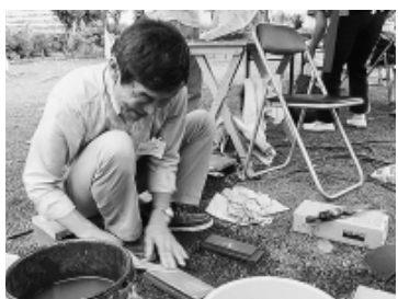
心をこめて (春日分会)