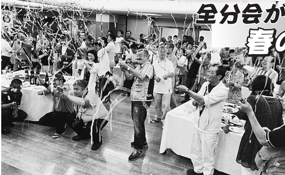
最高潮で幕を閉じた拡大打ち上げ式

発行所 東京土建一般労働組合 城北ブロック会議 東京都豊島区西池袋 5-22-15 板橋 (3963) 5325 練馬 (3825) 5522 豊島 (3986) 2471 北 (3902) 7121 発行人 代表者 佐藤 広平 発行日1日、9日、17日、25日