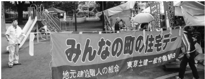
さあ始めよう(田柄分会)

6月1日の拡大打ち上げ式にて幕を閉じた「春の拡大月間」では、2ヶ月間にわたる仲間の奮闘によって、見事、支部本部目標を上回る315人の仲間を拡大した(支部目標23人超過、拡大率45%)、6月1日現勢で盛り上がりしました。 7、189人を築き上げた支部目標達成、そして全分会が目標達成という快挙を祝い、打ち上げ式では多くの仲間の参加で盛り上がりしました。