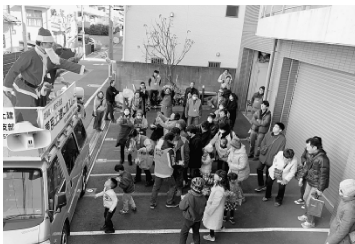
お菓子まきでにぎわうご近所感謝デー

「餅つきがなく寂しいです」という来場者からの声がありました。その閉会で、終了しました。