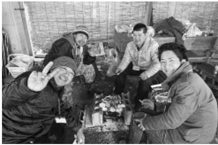
火起こしに苦戦しながらも楽しく交流中〜

お昼からは、特設会場に場所を移して、職種や世代で席割した昼食BBQ。一日たっぷり時間をとったの交流をとおして「仲間意識」が強まり、組合でつくる事業所同士の「仕事とくらしのネットワークづくり」は、さらに深まりました。(参加者の内訳は、事業主の会初参加8人、50歳未満21人、13業種)