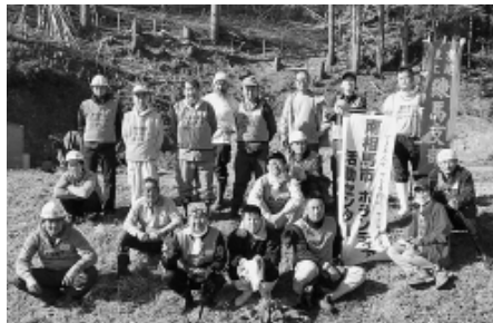
南相馬市復興ボランティア