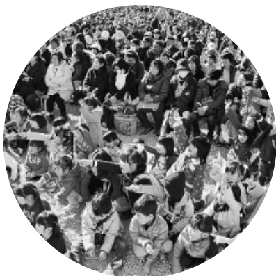
1万人を超える仲間の皆さん

「事業主の会・交流会」は、個人・法人問わず組合に加入している事業所の事業主(番頭含む)であれば、どなたでも参加できます。次回の「事業主の会・交流会」をお楽しみに。