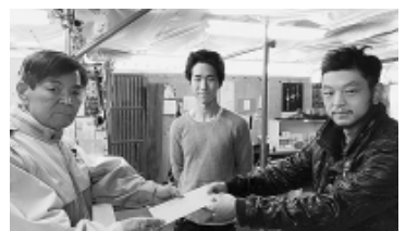
義援金をお渡ししました

11月25日(土)に、南相馬市復興ボランティアを練馬区職員労働組合と合同でおこない、東京土建練馬支部から10人、練馬区職労から8人の合計18人が参加しました。今年例年2日目に