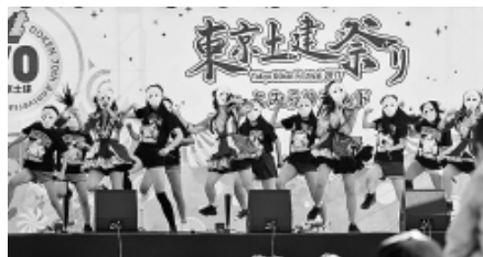
仮面女子ステージ