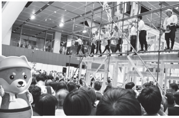
当日はカレッジ指導陣による上棟式も開催予定(写真は8月10日匠の祭典で行なわれた上棟式の様子)