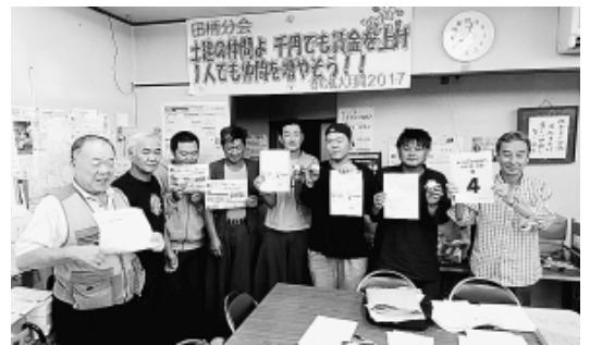
加入者と記念撮影 田柄分会

組織強化を目的とした全組合員訪問のとりくみでは、豊玉分会では区内名簿をもとに若手組合員を中心に訪問、1日に3人を活用し対象者を2