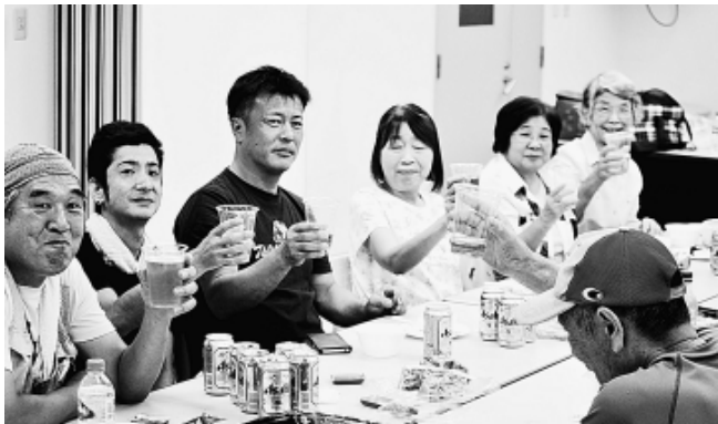
分会出陣式で盛り上げる練馬分会