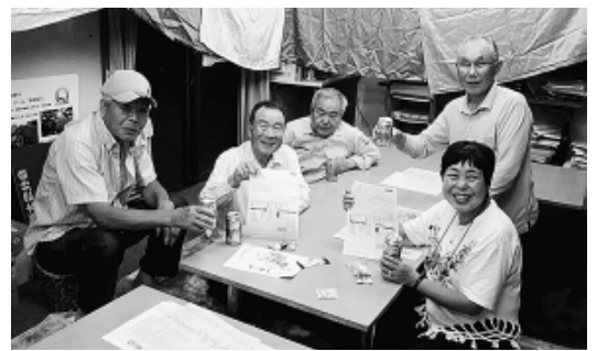
2名の加入をお祝いする新大泉分会