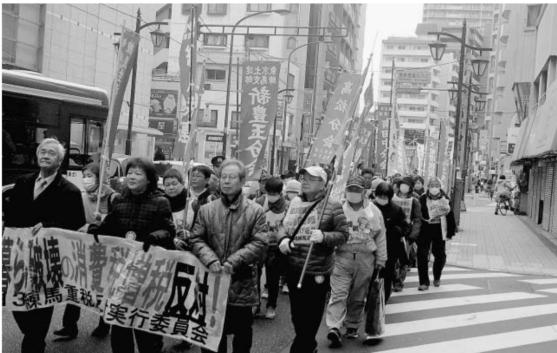
集会後は、税務署へ向けパレード&集団申告 3月13日 練馬駅付近にて