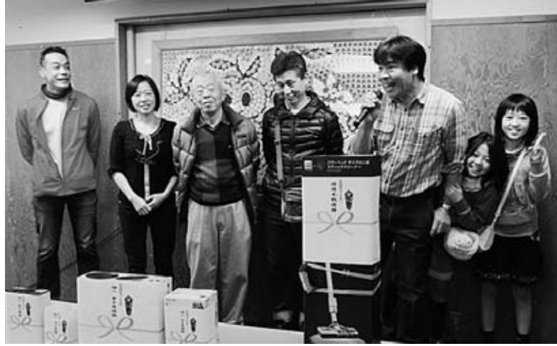
優勝の喜びあふれる笑顔 豊玉分会の皆さん

3月12日、池袋・ロサボウルにて毎年恒例の分会対抗ボウリング大会を行いました。キッズレーン、応援団も含め16分会24チーム、316人の組合員・家族が参加、28ある