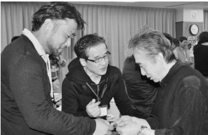
名刺交換・交流が活発に行われました 3月11日(土)練馬支部会館

今年度第3弾「事業主の会・春の交流会」を、3月11日(土)練馬支部会館にて28社31人の事業主が結集しました。今回の大きな特徴は、第一部の学習交流を、仕事の形態(工場)で2つの会場に分けて行った事です。第二部の「名刺交換&飲食交流会」では、異なる業種、町場事業所 向けには、組合が設立した「RECAO」の案内や制度説明、野工場事業所向けには「社保未加入問題や建設キャリアアップシステム情勢と現場」をテーマとした。今回、事業主の会「初参加」が、参加者の半数近くを占め、主の会のさらなる広がりが期待されています。参加者からは、「現場や仕事上で困っていること」について、6割を超える仲間が「低単価」次いで2割が「法定福利費の未支給」との声が寄せられたほか、「東京土建に期待すること」の問いには、依然として「仕事のネットワークづくり」が一番多くなっています。事業主の会では、今後も定期的に交流を軸に、建設産業をよりよくしていく取り組みや、仲間の期待に応えられるよう様々な取り組みを行ってまいります。