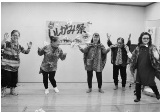
リズムに乗ってPPAP! 2月5日 石神井分会文化祭・いしがみ祭

2月5日(日)に、高野台集会所にて第一回石神井分会文化祭「いしがみ祭」を行いました。メリソろろのりき酒大会、童心に帰っての紙飛行機飛ばし、ピコ太郎の仮装で「みんなPPAP」なりきりコンテスト、花等踊りを行ったほか、将棋大会やタツ、水墨画、俳句、写真の展示のコーナーも設け、盛りだくさんの内容での催しとなりました。大きいお鍋一杯こしらえた豚汁も体が温まりホッとして好評で一日楽しく過ごしました。次回は、もっと多くの方に来場いただき開催出来ればよいと思います。