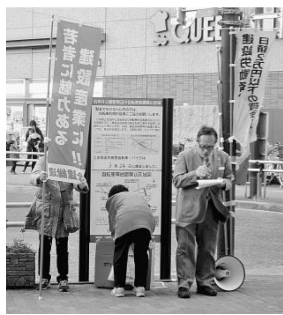
当日は区内4つの駅にて宣伝行動に取り組みました (3月24日 石神井公園駅北口)