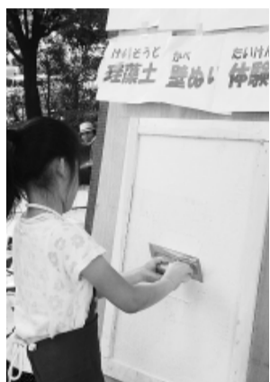
上手にできたね 関町北公園 (石神井台分会)