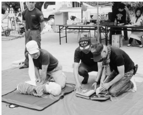
大泉二丁目防災会の協力でAEDを使用した 蘇生訓練 北大泉幼稚園(大泉東分会)

【雨の心配を 加が増えた】(西大泉、)「地域防災会と消防署の参加を軸にとりくみ、天気が恵まれない、思いのほか多くの来場者で一日にぎやかに住宅デーを終えることができた」(高松)「包丁とシ(3校、各300枚)を持って行き、各校の対応がすく良かった。各