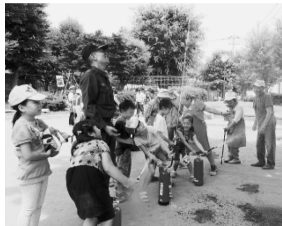
石神井和田町会防災会の協力で消火器の 放水訓練 光和公園(石神井分会)