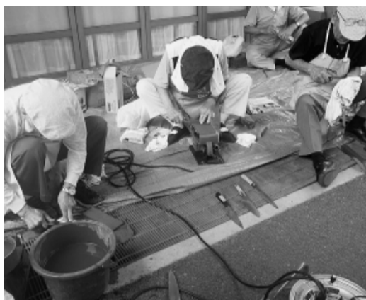
住宅デー やっぱり包丁 とぎが一番盛況 関区民 センター(関町分会)