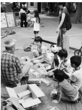
大人気の木工工作 田柄中央児童公園 (田柄分会)

【雨の心配を 加が増えた】(西大泉、)「地域防災会と消防署の参加を軸にとりくみ、天気が恵まれない、思いのほか多くの来場者で一日にぎやかに住宅デーを終えることができた」(高松)「包丁とシ(3校、各300枚)を持って行き、各校の対応がすく良かった。各