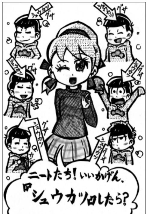
田柄分会 花輪 桃香