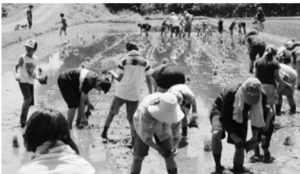
一本一本丹念に苗を植えました

初夏の爽やかな陽気の中へ。最初はみんな戸惑っていましたが、次第に素足で触れる泥の感触が心地良くなってきました。田植えは約1時間ほどで終了、手足を洗って着替えた後、昼食は