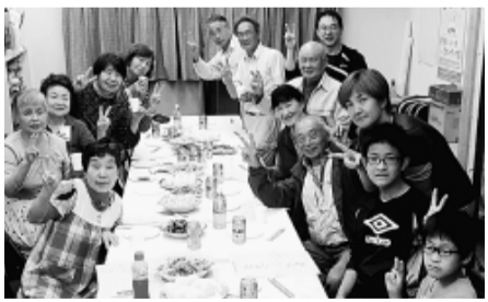
達成一番乗り！みんなで喜び分かちあう西大泉分会

月間での奮闘に心から感謝申し上げますとともに、今後の取り組みへ、さらなるご協力宜しくお願いします。