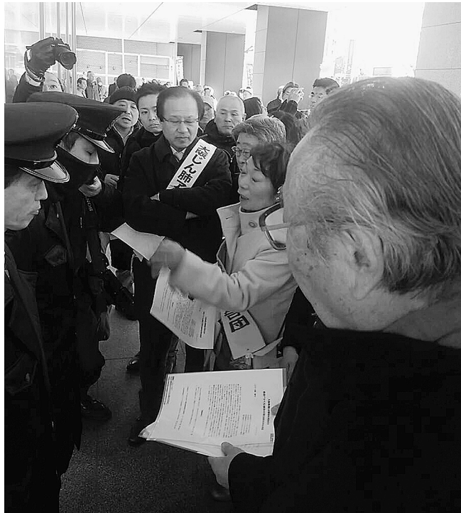
二チアス本社前で抗議する原告ら

の会」に合わせて、各ブロックのだしものによる交流を行い、安来節、花笠音頭などの踊りや合唱、手話と歌、ピアノ演奏など、多彩な演目で会場は大いに盛り上がりました。最後には、団結が