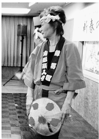
各ブロックから出し物が披露

学び、みんなで声をかけあつて女性健診を受けることの大切さを改めて実感しました。参加者からは、そもそも土建で女性健診を行っていることを知らなかったの、今後は受診したいなどの意見が出されました。また、昼食をとりながらの第二部では、今年のテーマ「今年がブロックでやります見せます主婦