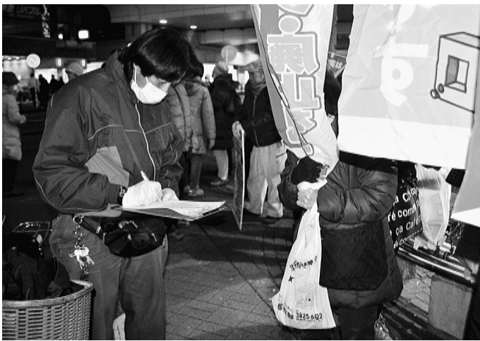
マイナス気温の中、署名に応じる練馬区民

さらなる消費税増税を阻止するため、3・13重税反対ねりま実行委員会が地域団体共闘を広く呼びかけ、9団体91人の仲間が結集、区内8駅頭で一斉に宣伝行動をおこなっていました。各駅での宣伝行動終了後は全員が練馬駅に集結。各駅頭の弁士による