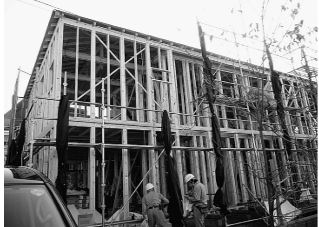
木造住宅の現場で、足場の安全基準などを確認