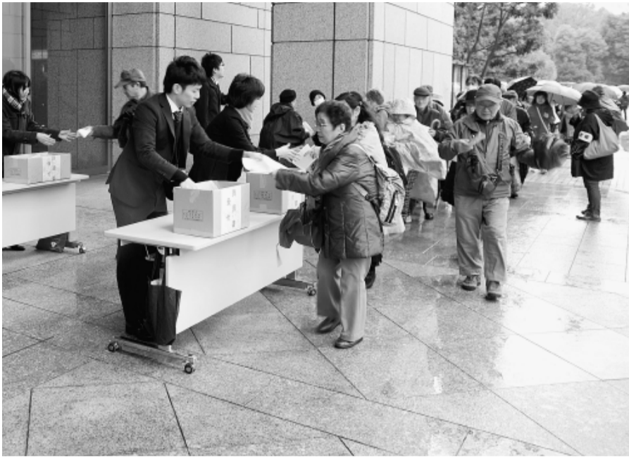
寒空の中、都庁へ請願行動を行う練馬支部の仲間

土建国保の補助金確保へ正念場 必要な予算を要求 賃金単価引き上げ！補助金獲得！ 11月25日、朝から冷たい雨が降る中、土建国保への予算獲得にむけて行なわれた建設不況打開・生活危機突破・予算要求集会に49県連、5178人が参加しました。 この日はまず、局、産業労働局、共産党 行いました。午前中に、都庁 交渉に参加)。東京都予 午後は、場所を日比谷前の新宿中央公園 算要求、仕事と就労確保、野外音楽堂・日比谷公園「水の広場」 諸要求実現、生活危機突 堂に移動。全国からさらに集合して、都 破、建設国保組合への現 多くの仲間が集まり、庁各部局・政党 行水準予算確保を訴え 全建総連の予算要求中央との交渉に要請 る、重要な対都要請行動 総決起大会を開催しまし 団を送り出しま ず。さらに東京都庁に た。今大会の主旨は「賃 した(練馬支部 対しても、集會参加者全 金・単価の引き上げ」と からは福祉保健 員による個人請願行動を 「予算要求」との二本柱