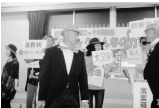
情勢をからめたヒゲダンス(大泉東分会)