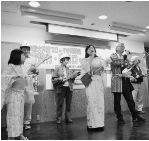
スコップ三味線を演奏 (豊玉分会)

発行所 東京土建一般労働組合 城北ブロック会議 東京都豊島区池袋5-22-15 板橋 (3963) 5325 練馬 (3825) 5522 豊島 (3986) 2471 北 (3902) 7121 発行人 平塚 浩幸 発行日1日、9日、17日、25日