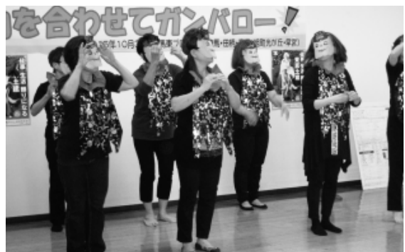
合唱する春日分会。このあとさらに…

拡大ブロック中間決起では、昨年同様に今回も分会ごとにパフォーマンスコンテストを実施しました。各分会工夫した中身となり、漫談、替え歌での合唱、パロディ寸劇や早口言葉、そしてコスチュームを用意したパフォーマンスを取り組み、会場を天いに盛りあげました。