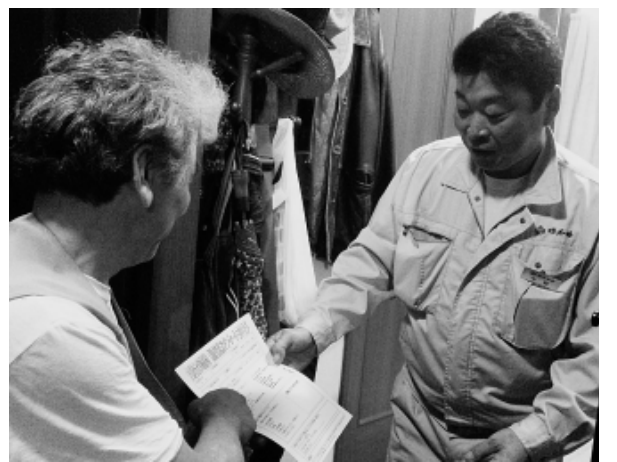
組合の仲間を訪問し、アンケートについて説明する分会の組織部長

組合では、秋の拡大運動の期間中、訪問行動をとりこんでいます。分会の仲間があなたの家を訪問し、組合制度活用のための申請書類(旅行やインフルエンサ補助の申請書などが同封されたマリット袋)と「あなたに会えてホッとした(コーヒー)」を持って伺います。組合へのアンケートの協力、まわりで組合に入っていない方の紹介のほうをよろしくお願ひいたします。