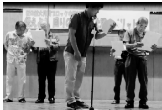
寸劇を披露する石神井台分会