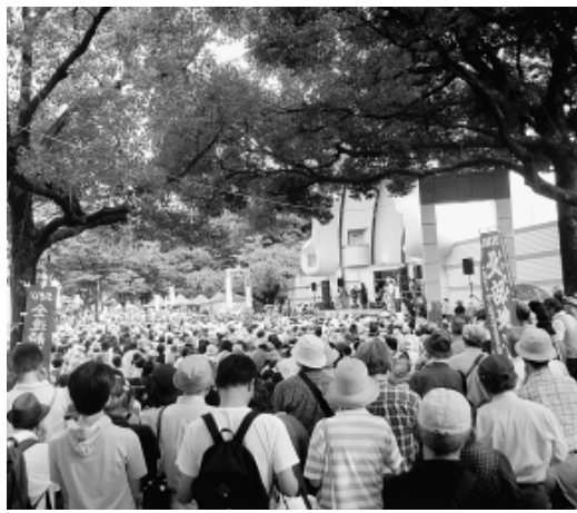
数万人規模の人が連日押し寄せています