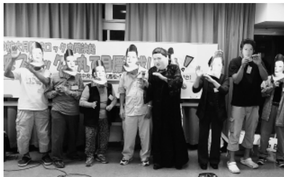
南田中分会は、マツコデラックス