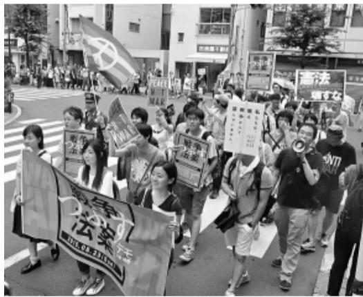
国会の周辺では連日抗議行動が行われています

東京土建では、安全保障関連法案に反対する総がかり行動に組合として取り組んでいます。春からの一連の行動にほぼ連日練馬支部の仲間が参加しています。参議院での審議、その後の強行採決の危険が高まる中、今まで政治活動と無縁と思われていた学生・主婦などから多くの参加があり、国会周辺は連日にぎわっています。戦争法案を廃案とする。この間、仕事帰りに片道2時間かけて来て、午後10時には電車に乗れないと帰れないという若者や友達に誘われて初めて参加した日に具合が悪くなって私のいる救護車に運ばれながらも帰る際に「また来ます」と笑顔で言った大学生など、これまでデモなど参加しなかった人がいる。国会前では連日数千人が集まり、国会前に集まる人々は、今までは若人たちが行われていました。私も、10代、20代の若者が参加して、国会前には無関心と思われていた若人たちが、今では国会前へ、高校生や中学生、主婦、学生や青年、制服を着た「何かおかしい」「これは危険だ」と自分自身の声をあげて、国会前へ駆けつけています。時には、のりサライマン、子どもを連れてお母さん、高