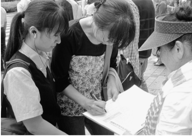
屋下がりの猛暑の中、親子で署名に応じてくれました

発行所 東京土建一般労働組合 城北ブロック会議 東京都豊島区池袋 5-22-15 板橋 (3963) 5325 練馬 (3825) 5522 豊島 (3986) 2471 北 (3902) 7121 発行人 代表者 佐藤 広平 発行日1日、9日、17日、25日