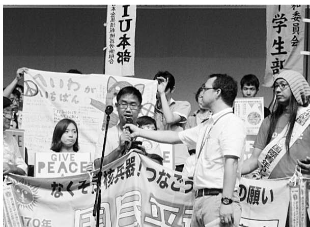
世界大会では若い参加者の発言が目立ちました

声明は、他国の戦争に関与することになる「存立危機事態」などの概念が極めて不明確で、歯止めのない集団的自衛権行使につながりかねないことや、政府が砂川事件最高裁判決を持ち出して、法案が「違憲ではない」と語りました。