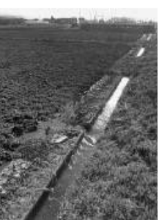
田植えへのラストスパート！

いよいよ田植えまであと少しです。乾いた田を掘る田起こし(地田)によって田打ちと田植えがしやすくなり、田んぼに植える苗に塩ビ管を使った取水口の自作して、微妙な水量の調節を行っています。水の管理によって品質や収穫量が変わるので大事な作業です。このあと、田んぼの土やワラにしっかりと水を吸わせた上で代かきを行います。代かきによって、表面の土が