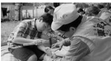
普段できない工作活動に没頭

5月9日(土)、練馬区の子供まつりが行なわれました。今年も石神井公園と光が丘公園の2会場で開催、定番の木工工作教室でものづくりの楽しさを伝えました。 毎年楽しみにしている子供たちが集まり、順番待ちに長蛇の列ができる人気振ります。しかも、年々女の子の参加が増加し、現在では工作教室に参加する子供のうち7割り近くが女の子です。 この日の作品は、小物入れとアルミ板工作。石神井公園会場は、小物入れ86個、アルミ板48個。