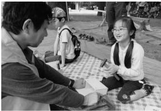
女の子も楽しくDIYを体験