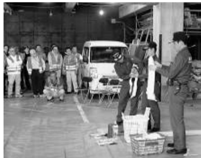
消防署の指導を受けるNAMAZUのメンバー

には交流会を開催。今日の学習と訓練の成果を振り返りながら参加者全員が終始なごやかに交流をしながら、「災害時の体系的に行動するイメージがもてた」、「クローズドゲームでは、具体的な