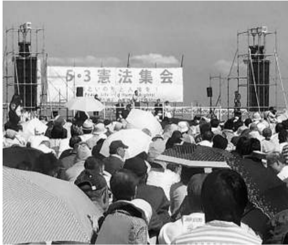
憲法記念日、強い日差しの中全国から終結

憲法改正に向けた国会の動きが本格化するなか、5月3日に横浜で開かれた改憲反対の集会には約3万人が参加。練馬支部からは12人が参加、