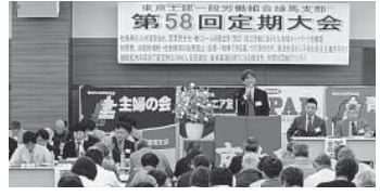
第58回定期大会の様子

税金対策では、マイナ健康診断の取り組みに、税金調査について、土支田分会より、の問題点と組合の立場について答弁がされました。