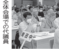
全体会場での代議員

どげんファミリーカード還元事業の利用状況報告や質問が多く出され、様々な共済制度を積極的に学び仲間へ広げていくことの意欲的な議論になりました。組合員を巻き込み支部発展につなげる視点から、積極的に発言が、後継者層へのシニア友の会の魅力と楽しさが伝わる議論となりました。