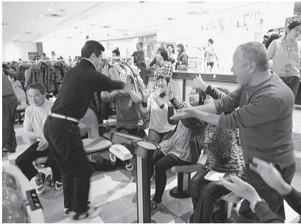
優勝へのハイタッチ！新大泉分会チーム

後継者対策部主催「分 会対抗スーパーボウリ ング大会」が3月1日(日) 高島平ホールにて開催さ れ、16分会33チーム熱 戦を繰り広げました。応 援もあわせて200人 で会場は大賑わい、分会 優勝へのハイタッチ！新大泉分会チーム