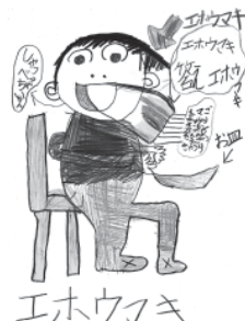
花輪大和・北練馬分会