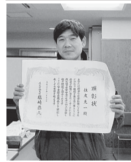
支部執行委員会が改めて表彰状をお披露目しました

対に反対です。 9条に守られた 日本の70年 大泉東分会 防衛費の増額につい て、軍事費が多くなり他 国に恐怖を与える。今回 のイスラム国の人質事件 で今後自衛隊が出て行 くようになるのか? 不 安だ。70年間日本は他国 を殺していないし、自衛 隊員も殺害されていな い。9条を守らないとだ めだ! 八方亭宮やっ のDVDや日弁連の集団 的自衛権のパンフレット を使っで行いました。