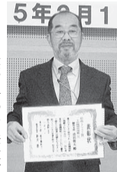
2月11日日本で行われた表彰式