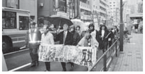
昨年の重税反対練馬区民集会

大阪の民商から全国へ 納税者の権利を求めて 毎年3月13日は、重税反対の集会和集団申告を行う日です。 大阪では、シャウブ勧告によって自主申告を基本とする申告納税制度を採用しました。しかし、税務署は確定申告時に中小業者を呼び出し、毎年秋に行なった概況調査(事前調査)をもとに、推計・把握した所得金額を「申告指導」として押しつけていました。 62年4月に国税通則法が成立すると、強権的な税務行政が推進されました。納税者の権利を守り、1970年にはじめてと組まれたこの行動は、そもそも大阪から広がったものでした。 大阪では、暴力で概況調査を妨害したとデモが行われ、1970年3・13重税反対全国統一行動へ、現在につながっています。