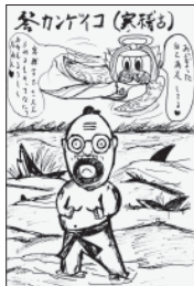
2月11日日本で行われた表彰式

今回「けんせつ北部」に参加させていただきまして、クロスワードを題材にした、はげ頭の体操のついでに描いた作品がイラスト、もりでクロスワードを解くというテーマで、表彰式、それにちなんで物語を添えながら応援いただきました。愛犬のイラスト