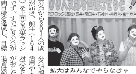
拡大はみんなでやらなきゃダメヨダメダメ(南田中分会)

「3年前「命の大運動」7000人支部回復を勝ちとる上で欠かすことのできないのは脱退防止の取り組みです。多くの 3年前「命の大運動」7000人支部回復を勝ちとる上で欠かすことのできないのは脱退防止の取り組みです。多くの 3年前「命の大運動」7000人支部回復を勝ちとる上で欠かすことのできないのは脱退防止の取り組みです。多くの