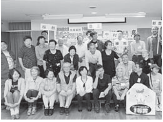
最後は記念にみんなでパチリ南ブロック