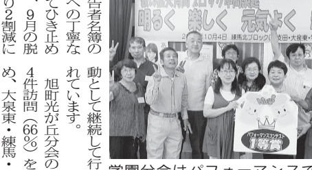
学園分会はパフォーマンスで1等

「あ」と「お」のころまでましげをおこないましょう。そして、10月30日においよいよ、終盤戦にはいります。これまで私たちの 「あ」と「お」のころまでましげをおこないましょう。そして、10月30日においよいよ、終盤戦にはいります。これまで私たちの