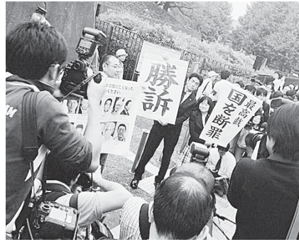
『勝利』の二文字に歓声が湧き起こった

10月9日アスベスト裁判の原告とされた大阪泉南のアスベスト国賠訴訟に、いよいよ最高裁の判決が下りました。この日、最高裁前には多くの報道陣や、想いをともにした原告、各団体個人が集い、待ちに待った「勝利」の旗出しがされると、歓喜の叫びが上がり会場は熱い決りとなりました。この日、最高裁前には多くの報道陣や、想いをともにした原告、各団体個人が集い、待ちに待った「勝利」の旗出しがされると、歓喜の叫びが上がり会場は熱い決りとなりました。