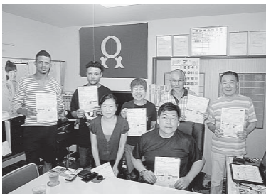
新大泉分会、またも6人の大型加入で年間13%目標達成！実増めざして秋もアクセル全開！

春一番拡大に続き、またもや「入集」となる6人の大型加入を勝ち取ったのは新大泉分会。「元組合員の社長が社会保険未加入問題で困っているから助けてあげた」と相談