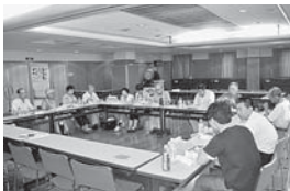
食事をしながら交流

「はなみずき会」は、じん肺アスペスト疾患の患者・家族・遺族が、情ため、2010年4月以降に労災認定された方も励ましあい被害者の立場から裁判・署名などの要求運動に取り組んでいく会です。毎年2回の交流会を開き、アスペスト連