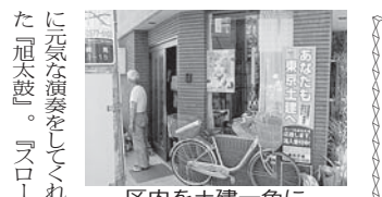
区内を土建一色に

家族をろって参加できる楽しい種目がいっぱい。秋の運動会が2年ぶりに開催されます。今年のは、都立城北中央公園、開会が午前9時30分です。 分会対抗で行いますので多くの仲間・家族の参加で優勝を目指しましょう。新たに組合に加入されたみなさんもお越しください。スポーツの秋を大いに満喫しましょう。 当日は悪天候の予想から一転して猛暑日になり、これから始まる2ヶ月間も燃えるような月間になる予感を感じさせ出陣式は幕を閉じました。 秋の拡大月間の柱にする全組合員訪問「私の要求アンケート」の訪問聞きとり行動がはじまっています。秋の拡大月間では区内の仲間を一軒一軒、要求アンケートの聞きとりと建設業を働いていない、訪問グッズや東京土建メット袋をもって皆さんのところへ訪問します。その協力をお願いします。