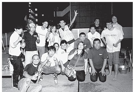
城北ブロックの青年部の仲間達

家族をろって参加できる楽しい種目がいっぱい。秋の運動会が2年ぶりに開催されます。今年のは、都立城北中央公園、開会が午前9時30分です。 分会対抗で行いますので多くの仲間・家族の参加で優勝を目指しましょう。新たに組合に加入されたみなさんもお越しください。スポーツの秋を大いに満喫しましょう。 当日は悪天候の予想から一転して猛暑日になり、これから始まる2ヶ月間も燃えるような月間になる予感を感じさせ出陣式は幕を閉じました。 秋の拡大月間の柱にする全組合員訪問「私の要求アンケート」の訪問聞きとり行動がはじまっています。秋の拡大月間では区内の仲間を一軒一軒、要求アンケートの聞きとりと建設業を働いていない、訪問グッズや東京土建メット袋をもって皆さんのところへ訪問します。その協力をお願いします。