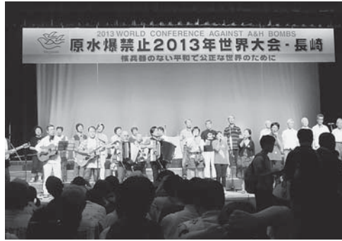
世界中から6500人が総会に参加

①日本経済の立て直しのためは、労働者の賃金改善が必要。毎年、新生銀行が労働者の手引き調査をおこなっている。97年では一ヶ月のサラリーマンのこずかいは67000円だった。今年の春は38000円。半減している。何が起こっているか、昼飯代は500円。弁当族が