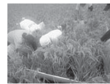
カメムシとクモの調査の様子

9月に入り、山形は朝晩だいぶ涼しくなりました。赤とんぼも田んぼに舞い戻り、もうすっかり秋の気配です。今年も初期の生育が良好だったので茎が例年よりしっかりして、穂も大きいものがたくさんついているようです。しかしこの時期の田んぼで気になるのはカメムシによる被害です。安心・安全なお米作りを目指す産直センターの農家の方々は、農業に頼らずお米や田んぼに住む生き物達の性質に合った方法で被害を抑えています。そのために「田んぼの生きもの調査」を行うなど日々の努力はさまざま。