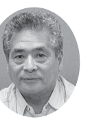
時と人恵まれ「練馬建設協議会」

「この任居を引越すことになり、身辺を整理していたら、亡くなった主人の日記を見つけた。そこには病気がなっ