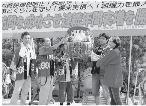
目標達成にむけてがんばろう

9月1日午前中は23分と58個の立て看板を設置。会158人の仲間が分会し区内を東京土建一色にセンターに集まり、合計うめつくしました。110枚の土建ポスター、一汗ながした午後から 「お疲れ様ーっ!!」 現場帰りの同世代の仲間達が集結し、青年部パーベキュー交流会は、大盛り上がりとなりました。急な残業等で不参加となった仲間が多数いたものの、そんな仲間達を代表して参加者はそれぞれの支部の活動の話題や、仲間作りの話題で話はずきませんでした。 こうして単純に「一緒に楽しむ」ことの出来る仲間を作る事が、青年要求実現のための活動の入り口で、「拡大の原点である」と自覚した僕たちは、これからも若い仲間が集いやすいように「楽しい」活動を行って、「急な残業等で不参加となった仲間が多数いたものの、そんな仲間達を代表して参加者はそれぞれの支部の活動の話題や、仲間作りの話題で話はずきませんでした。」 こうして単純に「一緒に楽しむ」ことの出来る仲間を作る事が、青年要求実現のための活動の入り口で、「拡大の原点である」と自覚した僕たちは、これからも若い仲間が集いやすいように「楽しい」活動を行って、「急な残業等で不参加となった仲間が多数いたものの、そんな仲間達を代表して参加者はそれぞれの支部の活動の話題や、仲間作りの話題で話はずきませんでした。」