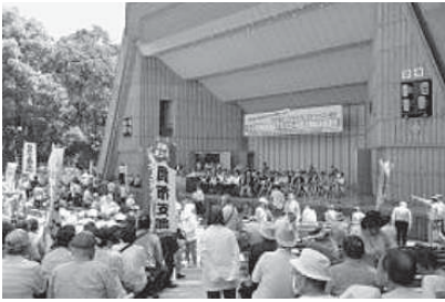
集会は首 人(練馬支 部50人)が 参加しまし た。