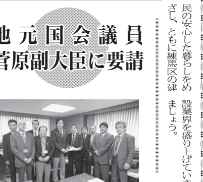
菅原副大臣に要請する組合代表

地域建設産業の発展も 練馬区の建設労働組合（全建総連傘下）は、ユニオンと土建のみです。練馬区で唯一であり、最大の建設労組といった組織となります。地域の建設業への貢献も、住