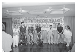
魚田後継者対策部長に紹介される新加入者

「原発ゼロへ、圧倒的な市民の声をたたきつけよう」と、「6・2NO」の諸行動が6月2日、明治公園・芝公園、国会前で行われました。三つのグループが台流して国会前に集まった6万人の人びとは、「原発ゼロを求め、民意に逆らって原発の再稼働・輸出を推進する安倍晋三内閣に、「原発いらない」「再稼働反対」の声を突 「原発ゼロへ、圧倒的な市民の声をたたきつけよう」と、「6・2NO」の諸行動が6月2日、明治公園・芝公園、国会前で行われました。三つのグループが台流して国会前に集まった6万人の人びとは、「原発ゼロを求め、民意に逆らって原発の再稼働・輸出を推進する安倍晋三内閣に、「原発いらない」「再稼働反対」の声を突