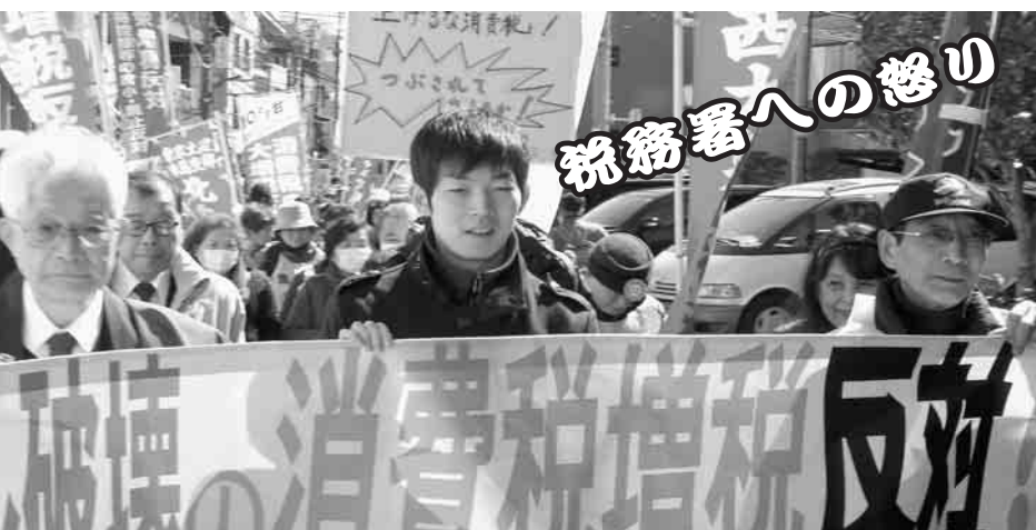
昨年の「3・13重税反対統一行動」集団申告へ向かう税務署までデモ行進

【日程】 3月13日(水) 2ヶ所(約14万人が集団申告に参加しています) 【場所】 2ヶ所 西税務署管轄 勤労福祉会館 ◆東税務署管轄 練馬生涯学習センター(旧練馬公民館) 【集合時間】 いずれの場所も 9時半~ 仲間を誘って集団申告!