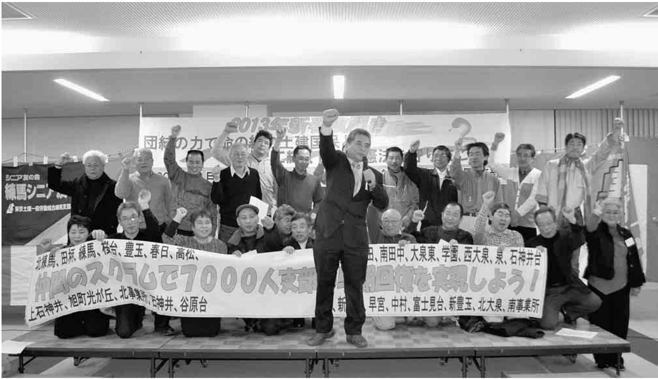
2013年新春旗開き 要求実現へ向けて団結ガンパロー

発行所 東京土建一般労働組合 城北ブロック会議 東京都豊島区池袋5-22-15 板橋 (3963) 5325 練馬 (3825) 5522 豊島 (3986) 2471 北 (3902) 7121 発行人 平塚 浩幸 発行日 1日、9日、17日、25日