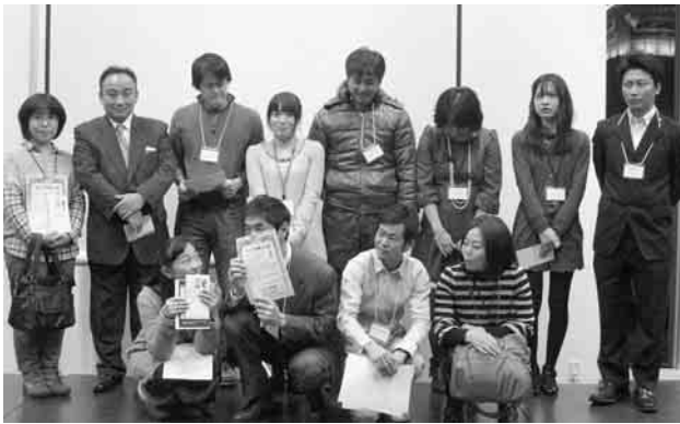
カップル成立の6組

東京土建本部後継者対策部主催の東京土建婚活パーティーが1月27日、秋葉原UDKビル4階キャラリーのスパシオにて、294人の参加で開催されました。