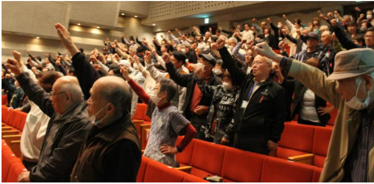
拳を突き上げながら「団結ガンバロー」を唱和する参加者

昨年12月、建設業で働く私たちは歴史的転換点を迎えました。第三次担い手3法は賃金・単価の引き上げや長時間労働は正などの処遇改善を求めるよりどころになります。「賃金を上げてくれと言ったら今後の仕事を回してくれないかも」とこの足を踏むのではなく、堂々と声を上げていきましょう。