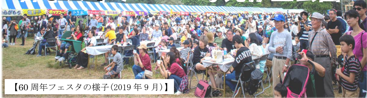
【60周年フェスタの様子(2019年9月)】