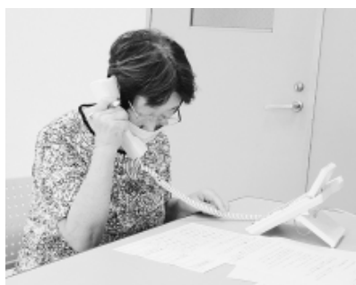
電話による対話で事業所へ働きかけを実施 (主婦の会)

ていました。第6分散会では谷原台分会の参加者が初めて活動者会議に7分散会では組合費滞納者への対話をきっかけと