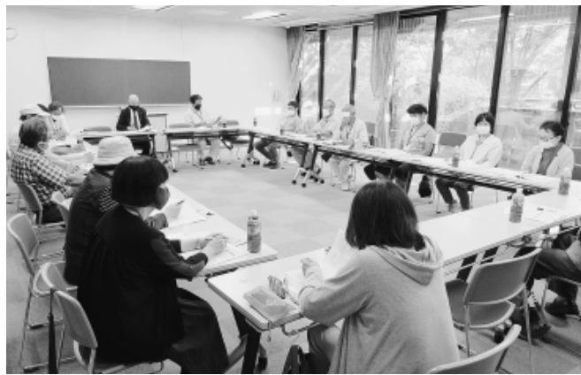
第2分散会の討論の様子

の工夫点、課題点、拡大対象者の状況などをテーマに議論を深めました。このうち、第1分散会では桜台分会の参加者が事業所の仲間にアンケートを求めると、その人数分の用紙を一括して事業主に渡し、1週間後に回収しているという、「複数回会うことの大切さを実感した」と報告。また南田中分会の参加者はアンケートに「市区町村国保の保険料が高い」と書いた仲間の自宅を訪問し、土建国保を紹介したと話しました。第3分散会では、若手が多かったことで、「拡大でSNSを上手に活用できれば、若者を取り込めるかも」と、時代に即した行動を採る