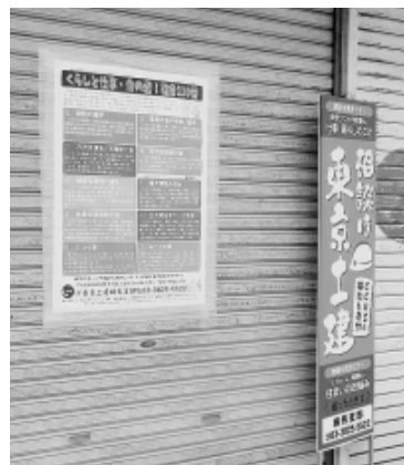
分会センターに支援制度を掲示 区民に組合の相談力をアピール (田柄分会)