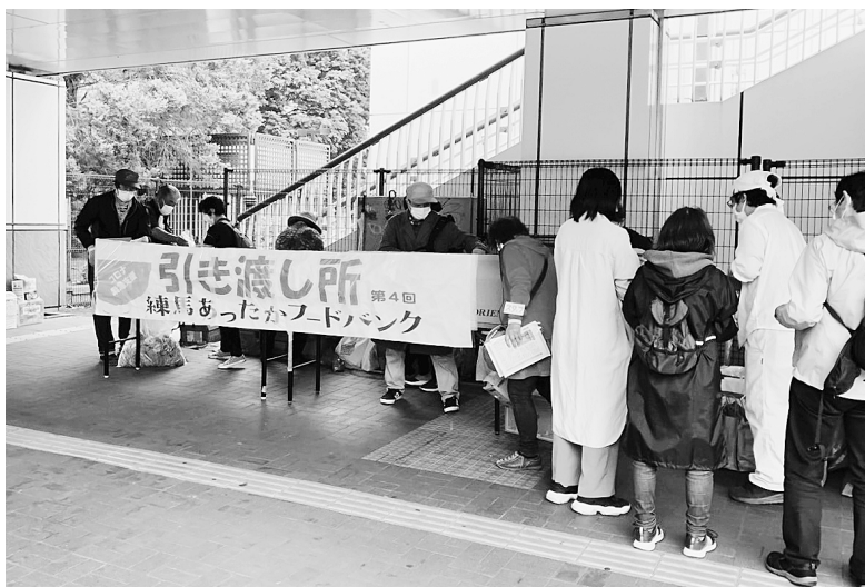
第4回練馬あったかフードバンクにて食料支援に集う参加者