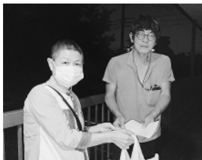
「組合110番」を配布 仲間との対話に活用 (関町分会)