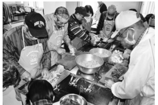
ぎょうざの餡も、野菜を細かく刻んでつくります

卓球は、2卓の卓球台を使用、豪快なスマッシュも飛び出すなど、楽しく汗をかきました。 その後、参加者全員で