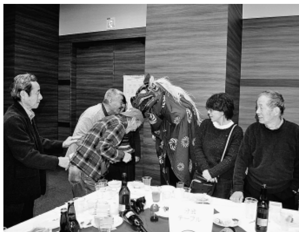
会場を練り歩く獅子舞に皆笑顔に

練馬支部は創設から58年が経過、加入組合員数は7004人となりました。建設産業は、震災復興や東京オリンピック関連、マンションや戸建てなどの住宅着工戸数の増加で人手不足になるなど、加えて人手不足になるなど、状況を呈していますが、実際に現場で汗水流して働く仲間の賃金は、依然として低い状況にあります。オリビック後は仕事が減るのではないかと心配の声も聞かれます。産業の維持のためには、若年者の入職が不可欠ですが、このような状況ではそれはあまり望めません。現状を打破するには、私たちがみんなで取り組む必要があります。昨年は、光が丘消防署が開催した防災フェスティバルに、東京土建が初めて参加したほか、練馬消防署から依頼により、支部会館を会場としての防災訓練を行いました。二つの訓練は、ともに消防署より高い評価を頂き、災害時に建設職人の持つ道具と、使いこなす技術と技能に大きな期待が寄せられることとなりました。今年は練馬消防署より、総合防水訓練への参加依頼を受け、参加する予定です。一方、政治についても大きく関心を持つ必要があります。昨年行われた参議院議員選挙の結果、憲法改正を目指す勢力が衆院・参院とも練は、ともに消防署より獲得し、憲法改正に向けて動きが見られます。共に謀罪についても、成立に向けた動きが活発です。私たちに与えられた優先順位は、建設アスベスト問題の早期解決と生活の安定。安心して働ける産業をつくりたいです。今年には都議会議員選挙が行われます。また、衆議院の解散総選挙があるのではないかとの報道も