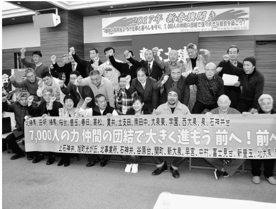
締めくくりに分會代表の登壇で2017年の活動への決意を表明 (2017年1月11日区民産業プラザココネリホール)