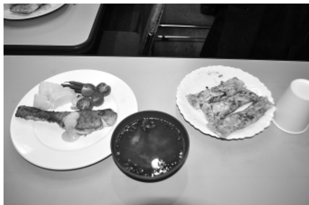
料理が完成 写真左から たらのムニエル塩麹ソース粉ふぎ芋、いんげん、ミニトマトを添えて・たたきレンコンと豚肉のスープ・棒ぎょうざ