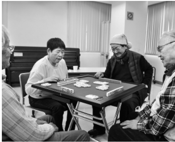
さあ、狙っている牌が来るか。皆、真剣です。

練馬支部では、65歳以上の組合員が集つ「シニア友の会」をつくり、年間を通し交流を中心とした楽しい取り組みを行っています。 1月8日(日)に冬の大交流会を支部会館にて開催。39人の参加で賑やかな一日を過ごしました。