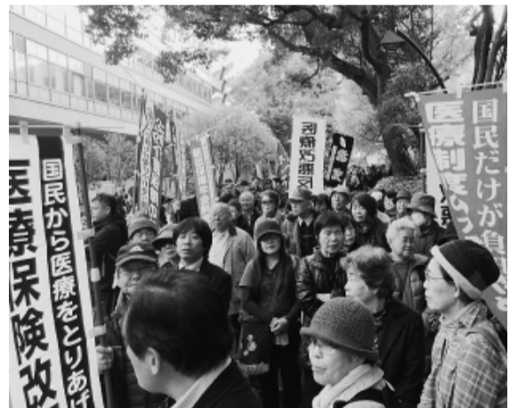
様々な要求旗を手にとり鍛冶橋へ出発直前の練馬支部の仲間たち

に手取りが減り、病院への医療費の支払いも困難に直面します。そのため、健康保険の内容の充実と保険料の負担軽減は、組合創設時から大切な要求となってきました。東京土建としても、取り組みの重点の一つです。