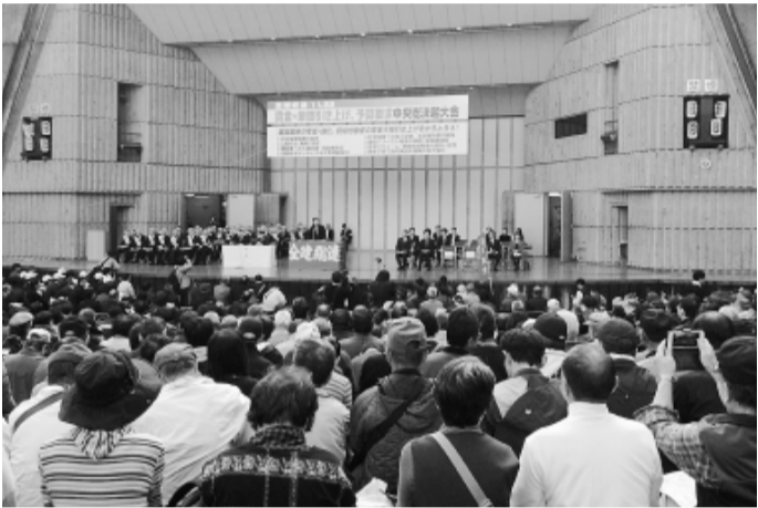
全国からかけつけた仲間で会場はぎっしり満員に (2016年11月22日 日比谷野外音楽堂)

建設国保予算満額求め 全建総連中央総決起大会 区民の声で区政転換 区民要求実現練馬大集会