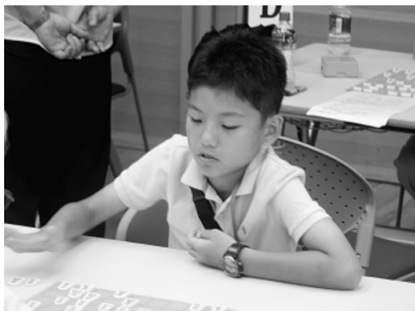
大人相手にガチンコ勝負だ

から。ゴルフ・カラオケの趣味に加えて、老後のボケ防止を目的に開始しました。はじめは当初は、経験者の人たちに全く歯が立たず、飛車・角の2枚の駒落ちでも敵わないほどでした。あらためて将棋の難しさと奥の深さを実感し、将棋本を数冊購入。CS放送のテレビ将棋番組でひたすら勉強。少しずつ棋力がアップし自信もついてきました。そして数年前から本部の将棋大会に参加させていただき、平成24年の大会ではC級ランクで優勝することができました。その後昇格したB級ランクに挑戦。そして今年の大会ではB級で全勝優勝を飾ることができました。大変嬉しく光栄に思います。