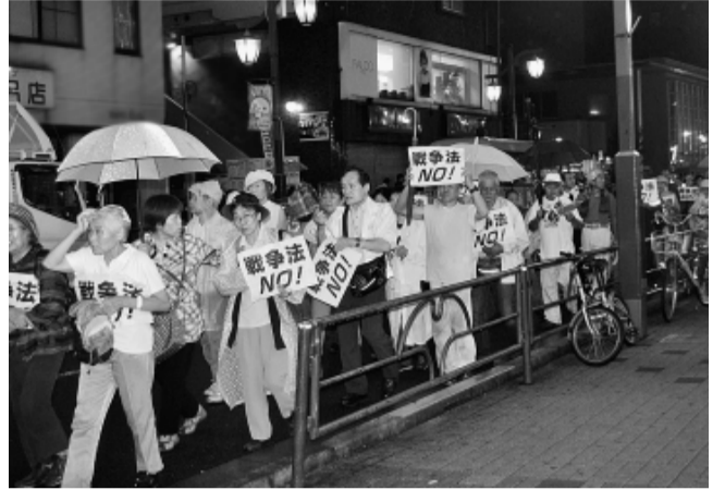
強い雨が降りしきる中、練馬区内をパレード行進

8月30日の国会前での戦争法案に反対する抗議行動には、全国から延べ35万人が参加し国会周辺を完全に取り囲みました。そして、全国各地でも連動して100万人1000ヶ所超で反対の声をあげました。 私は、その日も国会前へ。交通誘導などのお手伝いをしつつ、あまりの人数に歩道から車道へ人が溢れた際には、トラメガを片手にドラム隊と先頭で警察と押し合いへし合い、 途中からはSEALDsなどの学生たちを中心に「前へ！前へ！」の声を上げつつ、一歩ずつ前へ。車道にすら収まりきれない人たちは、それぞれの場所でプラカードを掲げ、「安倍はやめろー」との大コール。 それ以降も全国各地で広まる反対の声はどこまでも届くことを知らず、9月に入って国会審議が終盤に入ってくると連日、国会前でも抗議行動が取り 安全の為に参加者で自主的に交通誘導などを行っているにも関わらず、 この日は天候が悪く、集会直前には激しい雨が降り注ぎましたが、前回 7月に実施した最初の集会人数を上回る1500人(東京土建参加者183人)が集結する大会になりました。 集会開始時間には、ちょうど雨も上がり、ペタペタと吹奏でレセプションを開始。その後のリレートークでは、母親、 この行きかう人達の多くが手を振り、シユプレヒューブで「戦争法NO! ねりま集会」と打つと集会・パレード全容の動画がご覧いただけます。 参加者からは、「国会までは行けないけど、家の近くで声を上げることができてよかった」「練馬区だけでこんなにたくさん集るとは...すごい勇気づけられます」との声あり。事務局には、「高齢で集会には参加できないが、応援している」との電話をわざわざくれた区民の方もおりました。集会の状況は、イン ターネットにもアップされています。(YouTubeで「戦争法NO! ねりま集会」と打つと集会・パレード全容の動画がご覧いただけます。) またSNSでもさかんに取り上げられ、大きな話題となっています。私たち東京土建を含む労働3団体のよびかけによって始まった行動は、区内の市民団体や広範な個人を巻き込んだ草の根の運動として、大きなうねりとなりつつあり、戦争法案に反対する区民の声は着実に広がっています。 問答無用で参加者を押し将棋倒しの危険を作り出しています。参加者の中には老人や子どもがいるにも関わらず、揉み合いの中から助けた半泣きのおばあさんの顔を忘れることはできません。 国会に集う人は、日毎に増えています。憲法第12条にあるように今ある「自由や権利」は、私達自身の「不断の努力」で守らなければなりません。【書記局 田崎】