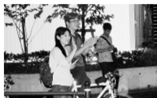
道行く人から賛同の拍手も