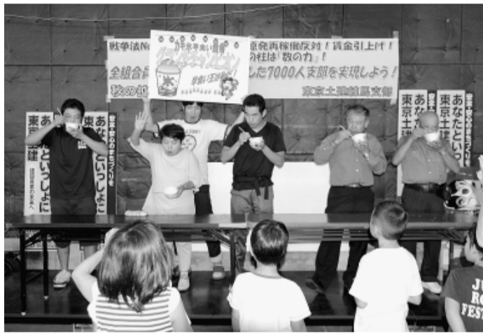
カキ氷の早食い競争で大盛り上がり、チビっ子も応援

中間を増やす秋の拡大月間がスタート。9月6日(日)午後1時から練馬支部の拡大出陣式が開催されました。この日はあいにくの雨予報。当初のつじ公園から会場を支部事務所に変更して開催。