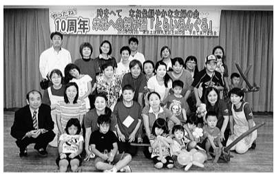
実行委員さんお疲れ様でした