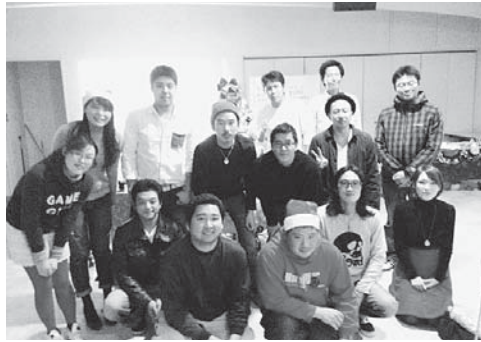
みんなそろってハイ笑顔!