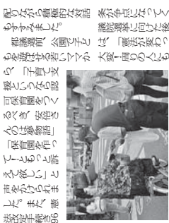
市民が参加している健康講座の様子。

大企業からの寄付が、選挙活動に活用されることへの懸念が広がっています。また、選挙活動の透明性の向上が求められています。市民からは、選挙活動の透明化が個人の自由や権利を守るのに必要不可欠であるという懸念が広がっています。