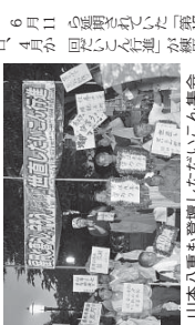
大雨の中、市民が集まり集会を行った様子。