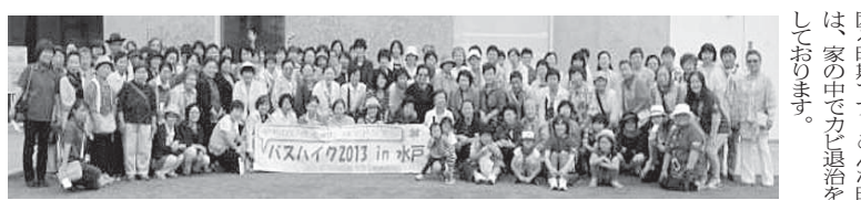
バスハイク2013 in 水戸