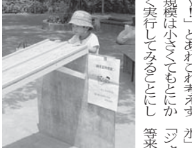
上石神井...レーシングカー行

【上石神井分会】 梅雨の中休み。か好転 に恵まれ、会場設営時 から気温も高く暑さのなか 実行委員をはじめ組合員 ・家族28人の参加、協力 を得ることで無事に開催 できました。今回の住宅 「激安バザー」を運営して 頂きました。売上げも好調 のようでした。恒例の包丁 研ぎ ・まな板削り・住宅相談 コーナーは勿論、分會 27人の会のお母ちゃん 達はお袋の味とん汁 を主婦の会の皆さんには 毎回好評な「激安バザ 」を運営して頂きまし ました。恒例の包丁研ぎ ・まな板削り・住宅相談 コーナーは勿論、分會 27人の会のお母ちゃん 達はお袋の味とん汁 を主婦の会の皆さんには 毎回好評な「激安バザ 」を運営して頂きまし ました。