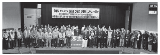
大会成功に力尽くした運営委員のみなさん

「男の料理教室はかっか」の調理教室はかっか。シニアの会については「隣の分会との交流を」との意見も出されました。