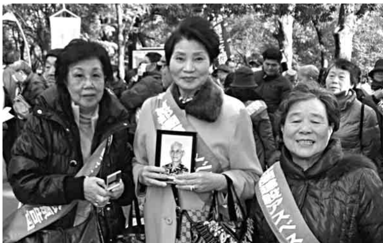
親子三代で建退共(三面参照)

主婦の会とらいあんぐるクリスマス会、子供たちの握る紐の先にはプレゼント。この笑顔を守るのは私たち。平和なればこそ!!