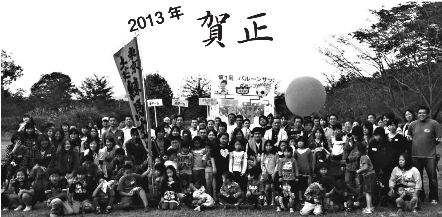
後継者対策部主催・サマージャンボリターンズ「学んで遊んで」企画運営もやりきったぞ！