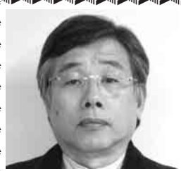
住宅メーカーが適正な 発注元のゼネコン、

あけましておめでと うございます。昨年は 私達にとつて大変な一 年でありました。