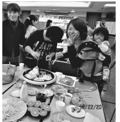
お好み焼き、ヤキソバ、パフェ エネルギーの源はこれこれ!